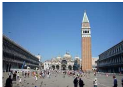
Markusplatz in Venedig

Nach der Stadtführung werden wir in einem typischen Vaporetto zu einer Lagunenrundfahrt aufbrechen.