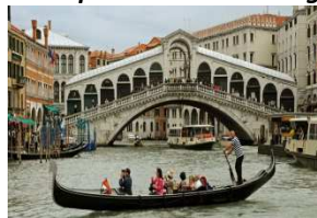
Rialto-Brücke in Venedig, vorn Gondel, im Hintergrund Vaporetto

Die Übernachtung an diesem Abend wird in einem Hotel in Lido de Jesolo, 40 Kilometer von Venedig entfernt, erfolgen.