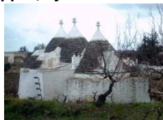
Trullo mit rundem Steindach

Von Ostuni aus fahren wir weiter nach Alberobello, wo wir die Hl. Antonius Kirche besuchen können. Danach erwartet uns eine Weinprobe mit Imbiss in einem typischen „Trullo“ / Rundhaus dessen Steindach sich nach oben hin in einem Kraggewölbe (sogenanntes „falsches Gewölbe“) verjüngt und mit einem symbolischen Schlussstein, dem Zippus, oft aber auch mit einer Kugel oder einem anderen Symbol,