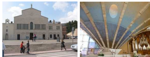
Wallfahrtskirche San Pio da Pietrelcina in San Giovanni Rotondo

Der nächste Tag führt uns zur berühmten Wallfahrtskirche La Chiesa San Pio da Pietrelcina in