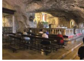
Michaelsgrotte in Monte Sant'Angelo

Die Besichtigung der Michaelsgrotte wird Sie begeistern.